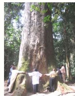
En signe de solidarité, des députés entourent l'arbre le plus large de d'Afrique de l'Ouest

“ Il se peut que bien des délégués à Vienne n'aient pas pris acte des efforts déployés par les pauvres eux-mêmes pour lutter contre la pauvreté et le sous-développement ”