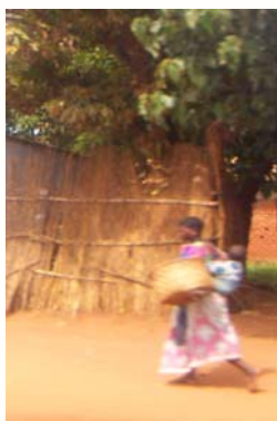
Le Malawi a le deuxième plus haut taux de mortalité maternelle dans le monde selon les Nations Unies

“Les réseaux servent de source sûre d’encouragement et de moyen de découvrir ce avec quoi d’autres parlementaires... ont eu à composer et ... les approches recommandées”