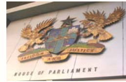
Emblème du Parlement du Ghana

Plusieurs stratégies ont été proposées pour guider le Ghana dans la voie à suivre, reste à savoir sur laquelle le pays portera son choix. Dans leurs examens, le Centre parlementaire, la Banque mondiale et le NDI suggèrent diverses stratégies pour améliorer la participation des parlementaires aux DSRP. En voici quelques-unes :