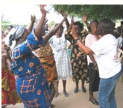
Des parlementaires d'une douzaine de pays africains participant à interface entre communautés du district de Dangme Est de la grande région d'Accra au Ghana

“Le Parlement du Ghana a fait des progrès notables en constituant une commission parlementaire chargée de la réduction de la pauvreté à ses troisième et quatrième législatures”