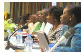
Des députés ghanéens participant à un atelier sur le processus budgétaire, organisé sous l'égide du Projet d'appui aux commissions du Parlement du Ghana—Phase 2 avec l'appui du Centre parlementaire.

“Les fonds pour la mise en œuvre des activités liées aux DSRP dépendant étroitement du budget national, les parlements peuvent jouer un rôle clé pour assurer la conformité”