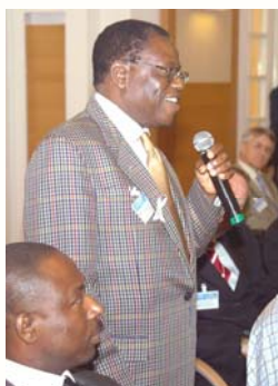
Hon. Louis Chimango, Président de l'Assemblée nationale du Malawi

“Les réseaux servent de source sûre d’encouragement et de moyen de découvrir ce avec quoi d’autres parlementaires... ont eu à composer et ... les approches recommandées”