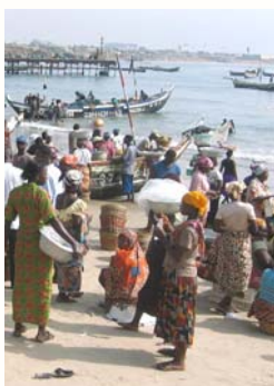
La pêche demeure au Ghana une des activités économiques les plus importantes du pays

“Le Parlement du Ghana a fait des progrès notables en constituant une commission parlementaire chargée de la réduction de la pauvreté à ses troisième et quatrième législatures”