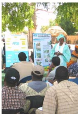
Les organisations de la société civile jouent un rôle de premier plan dans la production d'information, la recherche, l'analyse de données et la diffusion de l'information découlant système de suivi de la pauvreté

“ Les OSC participent de près au repérage des lacunes dans la recherche et à l'établissement des priorités de recherche dans le contexte du suivi de la SNCRP ”